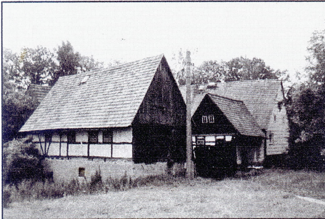
Casparmühle Thalheim, 2000