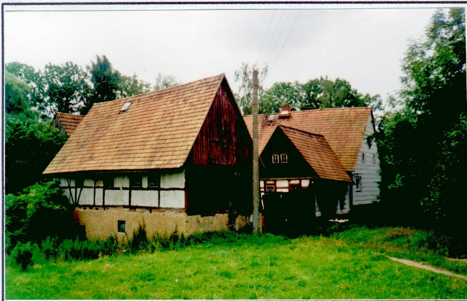
Casparymühle Wiederau, 2000