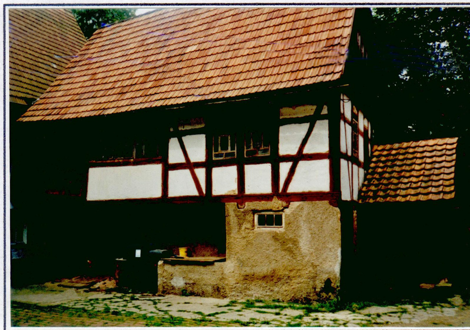
Hofansicht Mühlengebäude, 2000