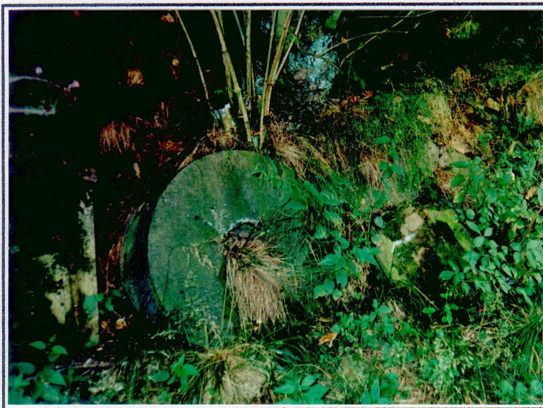
alter Mühlstein und Mühlgrabenreste, 2000