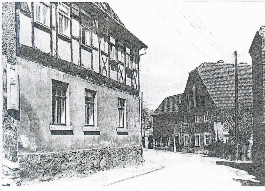
Die einstige Grützmühle (rechts) in der Dittmannsdorfer Straße. Aufnahme von 1955.