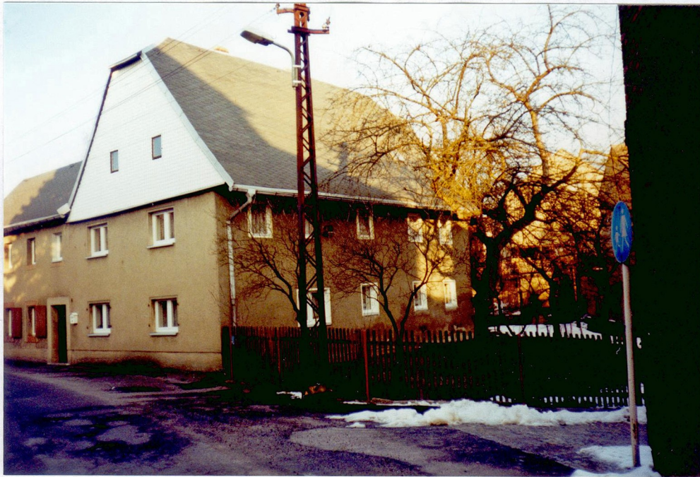
ehemalige Grütz- und Graupenmühle heute Wohnhaus von Fam. Otto