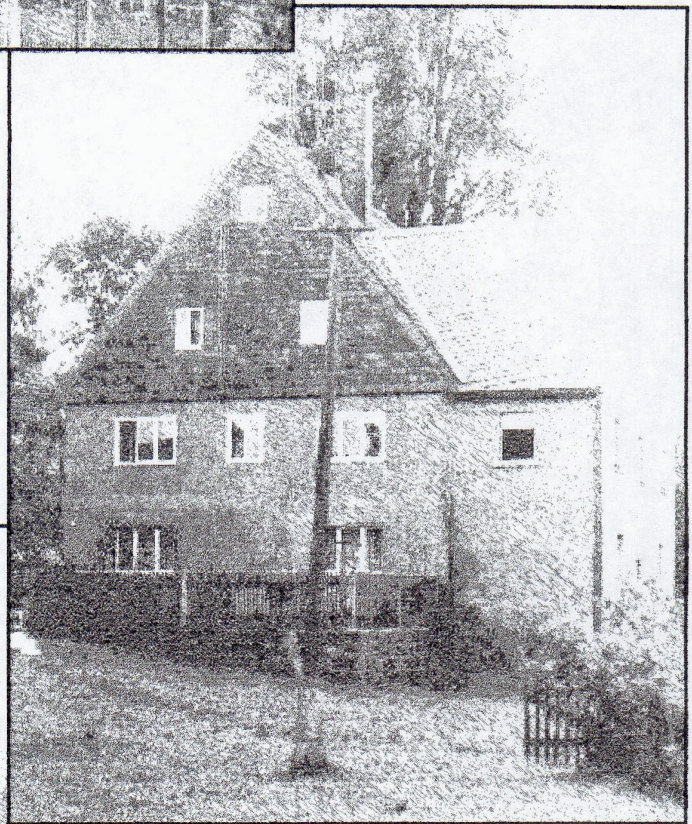
Aufnahme vom 16.9.1979