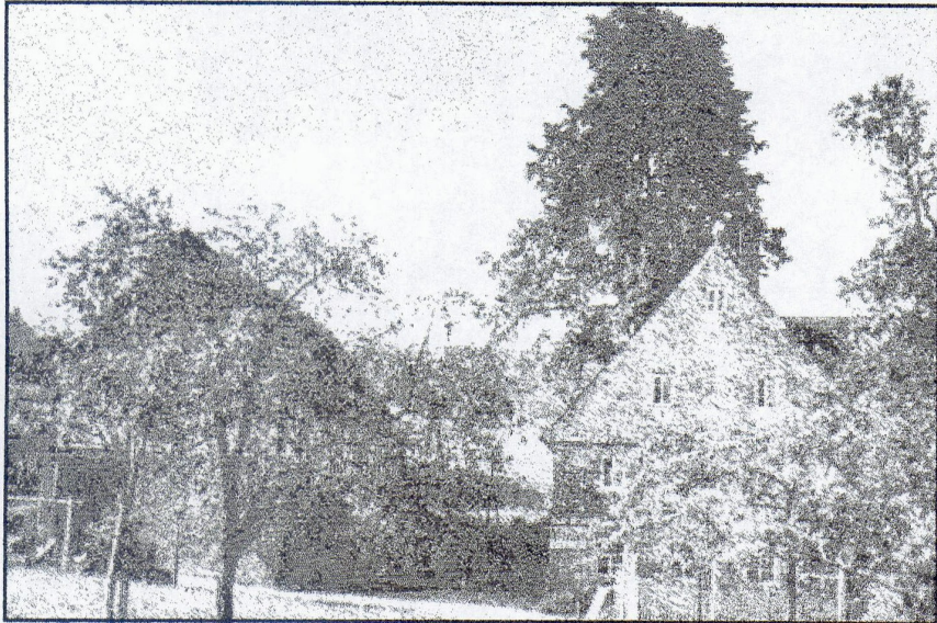
Aufnahme vom 18.5.1959