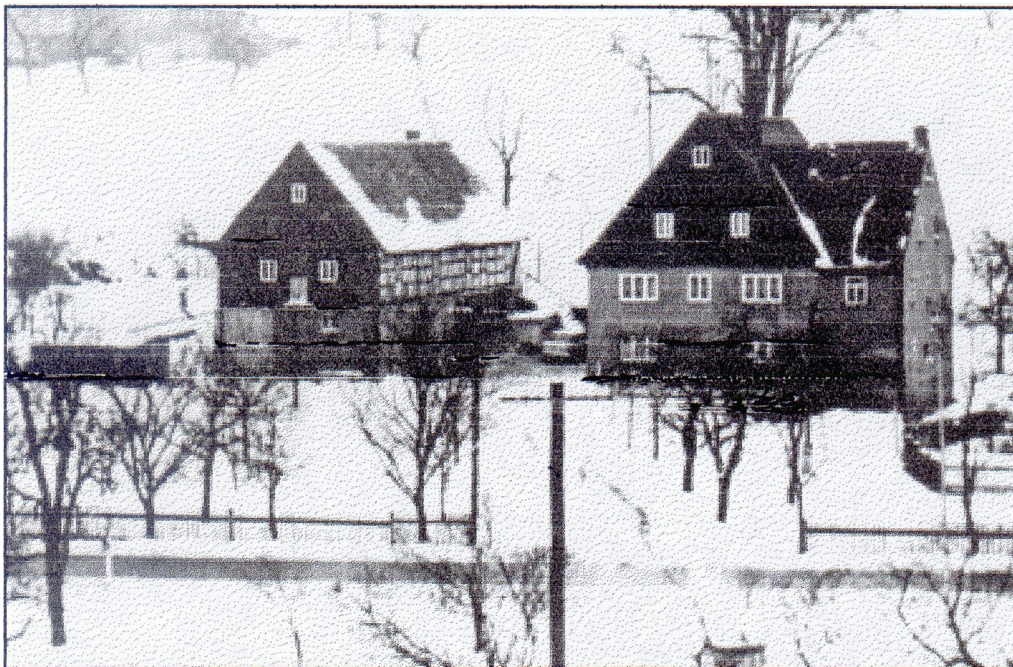
Mittelmühle Rossau, um 1960