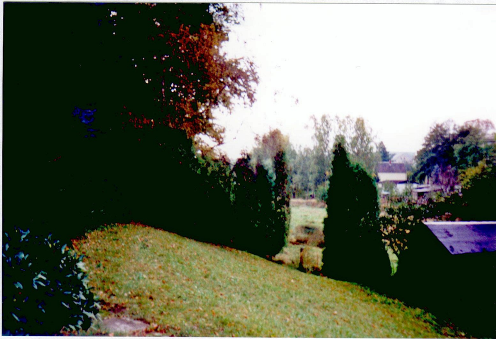
Verlauf des ehemaligen Mühlgrabens