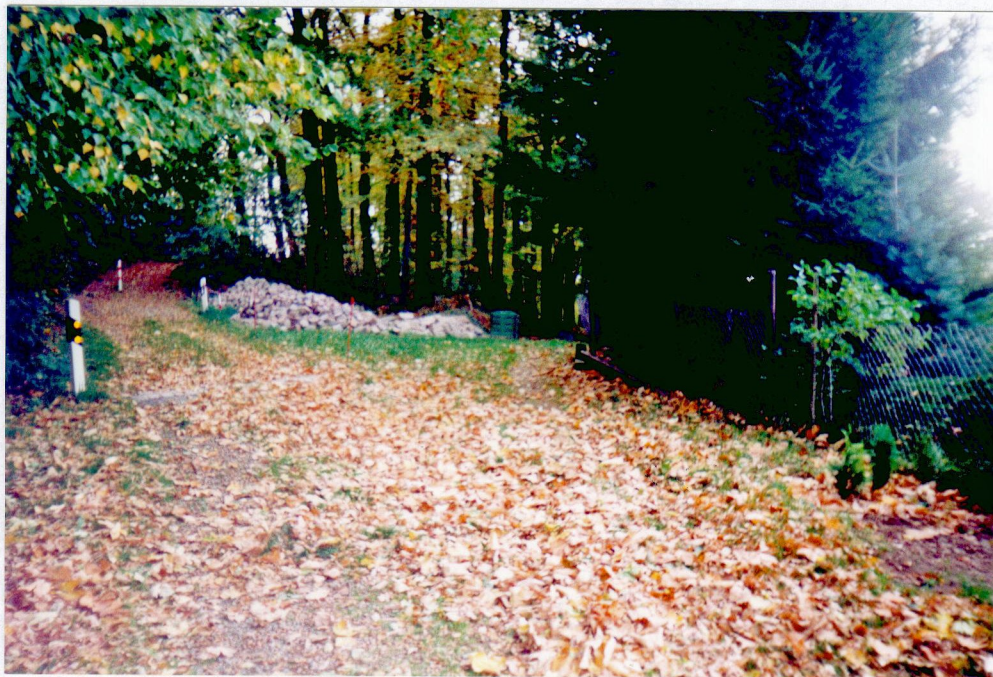
alter Zufahrtsweg hinter der ehemaligen Mühle