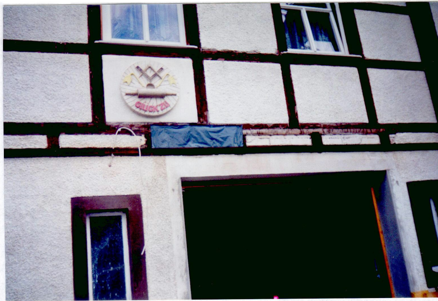
Müllerzeichen über der Eingangstür