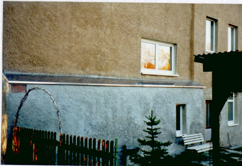
Standort des Mühlrades