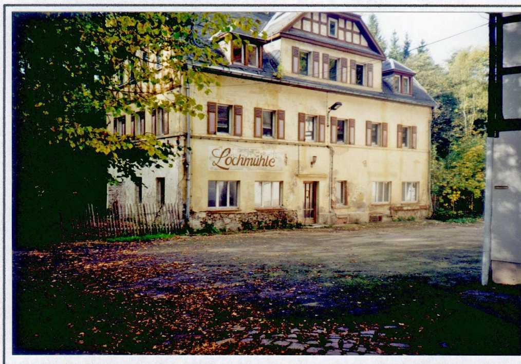
Lochmühle Erlebach Foto: 2000