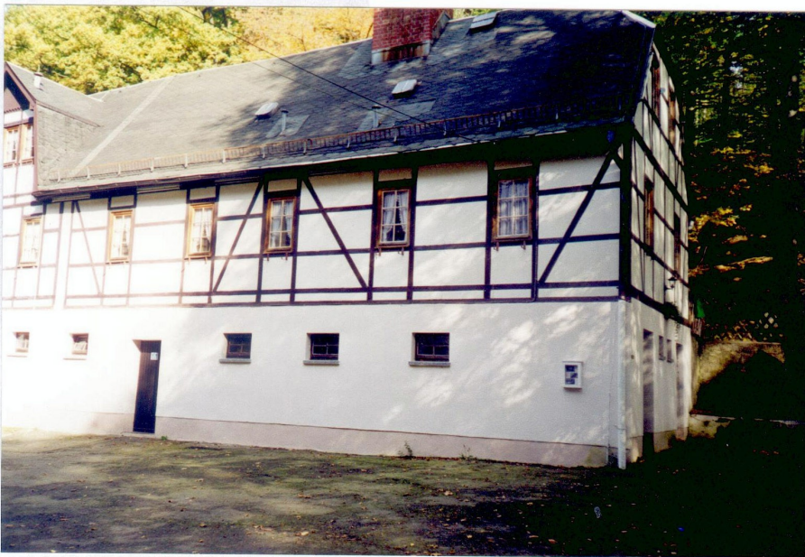
Bettenhaus der Gaststätte Lochmühle