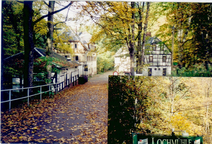
Einfahrt zur Lochmühle