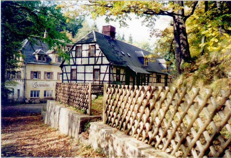
ehemalige Lochmühle mit Bettenhaus